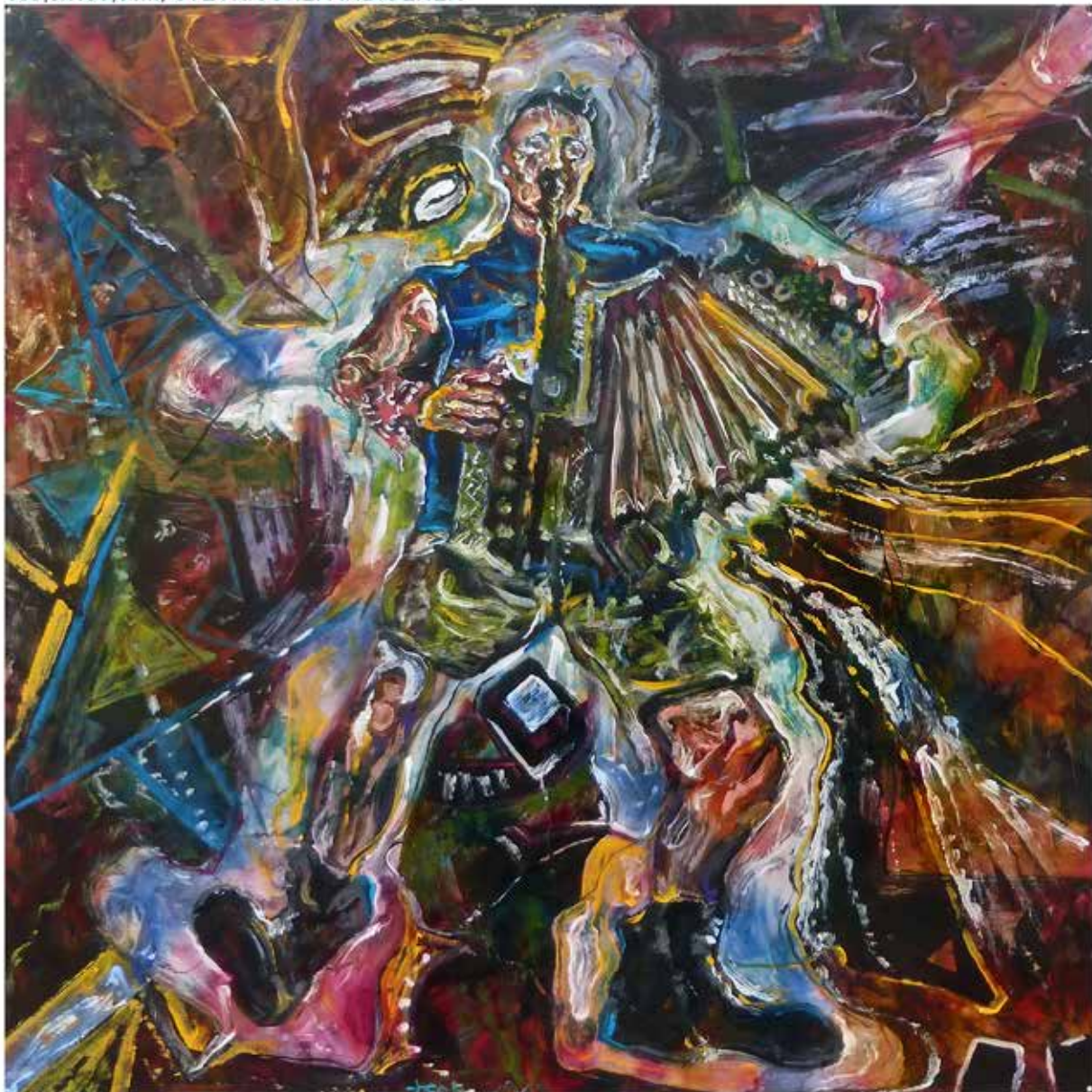
103,5x103,5cm, STEYRISCHER INDIGENER